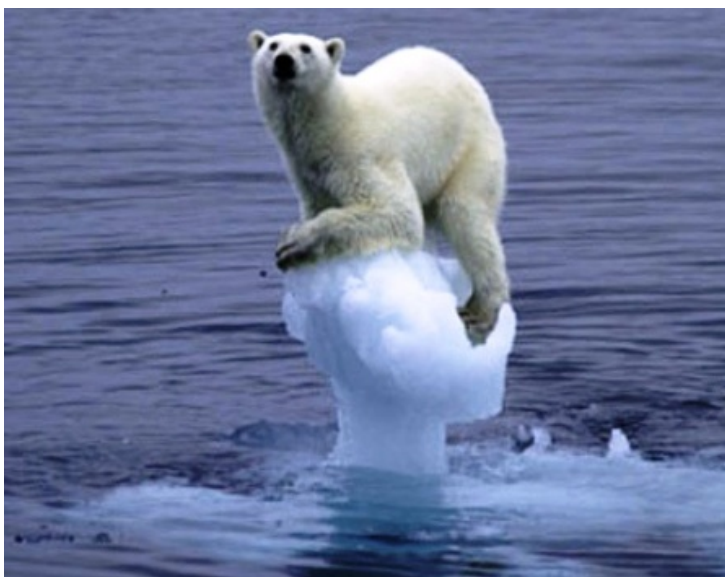
Anche gli orsi polari sono preoccupati

In collaborazione con l'Ambasciata di Francia e l'Istituto Francese di Firenze